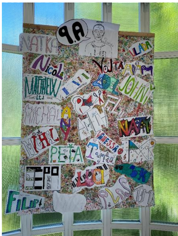
Tabla našich letošních absolventů