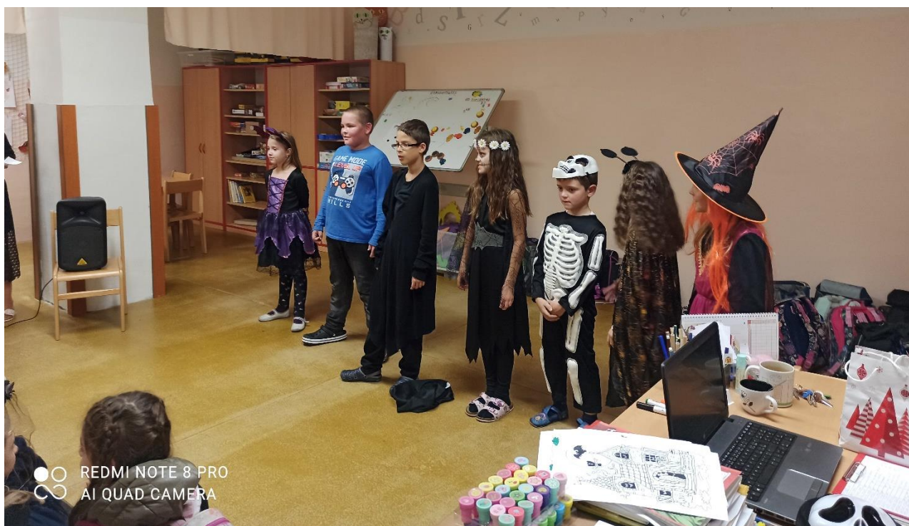
Kolektiv školní družiny

Fotografie z těchto akcí si můžete prohlédnout na webových stránkách naší školy.